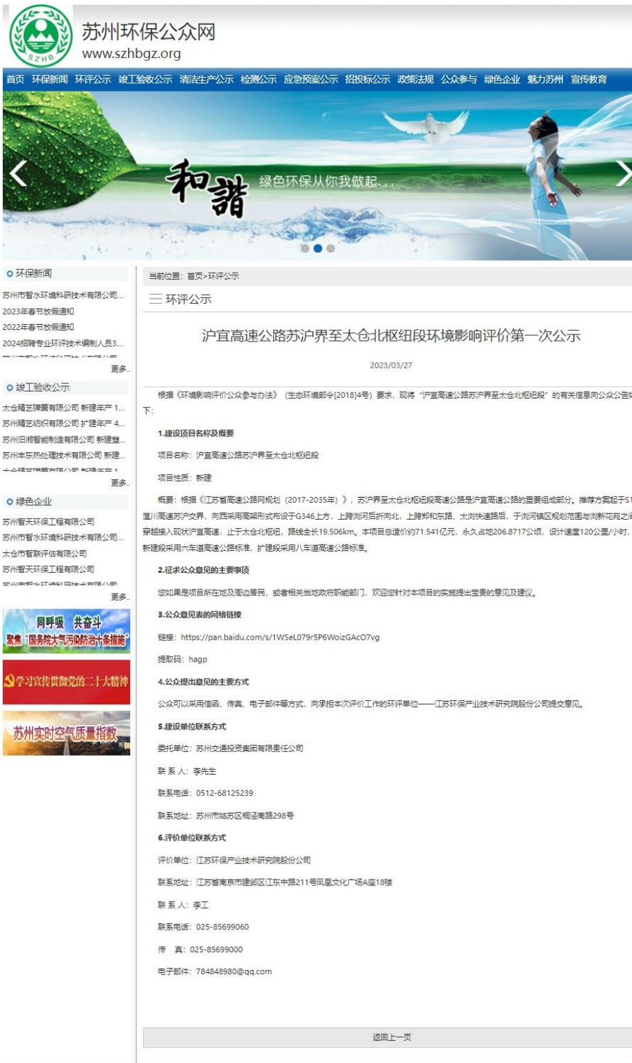
图 2.2-1 苏州环保公众网公示截图