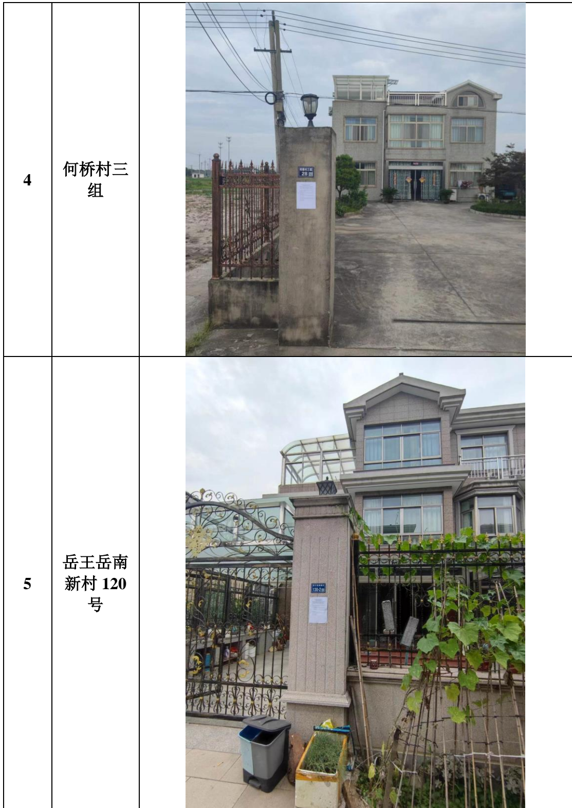
图 3.2-4 现场张贴公告照片