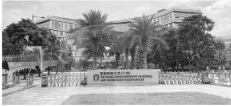
香港科技大学（广州）即将迎来开学一周年。

“它的交通便利，人才聚集也很容易。我们2020年就开始在全球招聘人才，现在已经差不多招聘了2000人，来自全球各个著名学校。”他们不仅对南沙的发展有很大贡献，在科技创新方面