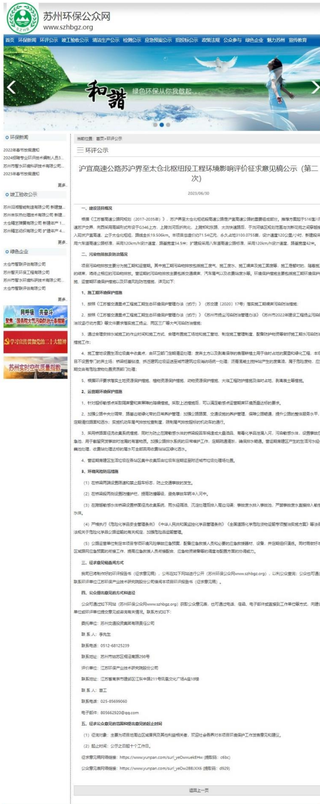
图 3.2-1 征求意见稿公示截图