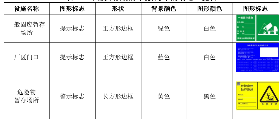
表 4-21 固废堆放场的环境保护图形标志一览表

根据国家环保总局和江苏省环保厅对排污口规范化整治的要求，建设单位按照《环境保护图形标志—固体废物贮存（处置）场》（GB15562.2-1995）修改单、苏环办（2019）327号和《危险废物识别标志设置技术规范》（HJ 1276-2022）设置固体废物堆放场的环境保护图形标志。本项目固废堆放场环境保护图形标志的具体要求见下表 4-21：