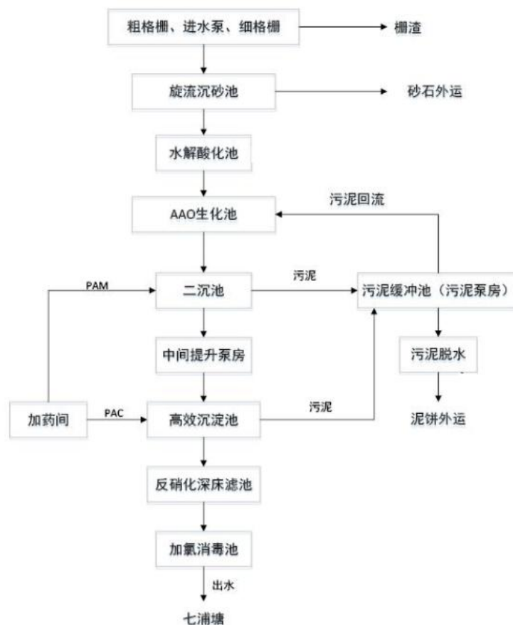
附图 4-1 沙溪污水处理厂污水处理工艺