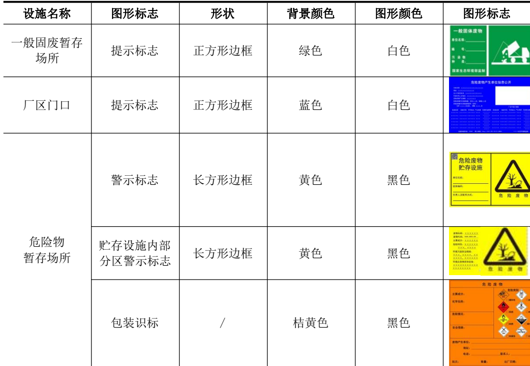
表 4-23 固废堆放场的环境保护图形标志一览表